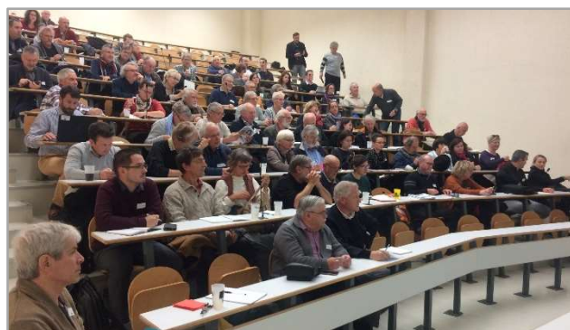
Colloque sur les Transitions à Lorient le 30 octobre 2018

Le Conseil de Développement a également accueilli l'Assemblée Générale du réseau qui s'est déroulée à Corseul le 17 décembre.