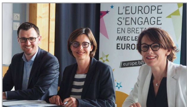
Signature du Contrat de Partenariat le 17 avril 2018

Plusieurs membres du Conseil ont également été désignés pour siéger au sein des instances locales de pilotage du contrat : le Comité unique de programmation et la Commission Mer et Littoral.