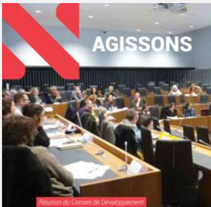
Réunion du Conseil de Développement