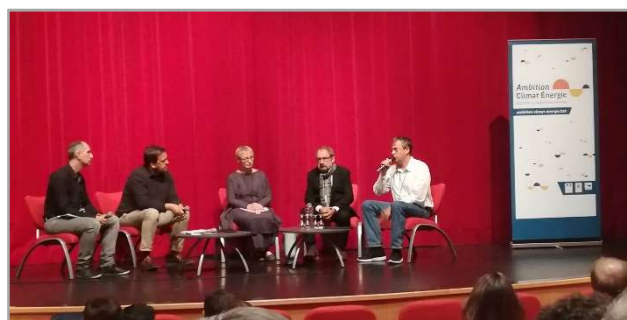
« Elus et citoyens mobilisés pour une transition réussie » le 26 septembre à Pontivy