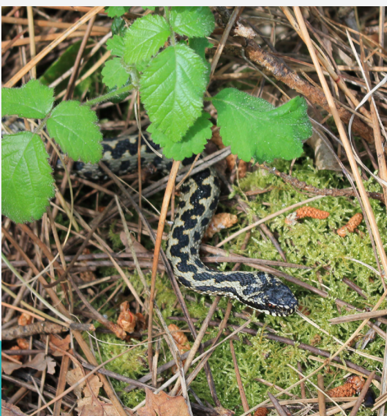
La vipère péliade

Les reptiles sont des animaux ectothermes, ils sont donc incapables de produire par eux-mêmes la chaleur de leur corps, qui est entièrement dépendante de la température extérieure. Lorsque la température chute, il est donc nécessaire pour eux de s'exposer au soleil ou de trouver une cachette où rester à l'abri en attendant des conditions plus propices. A l'inverse, lorsque la température augmente trop, ils ont besoin de cachettes où se mettre à l'ombre. La lisière, à l'interface entre des milieux plus exposés et d'autres plus ombragés, est un habitat de prédilection pour les reptiles. Pour favoriser ces derniers, il est également possible de créer des hibernaculums, des abris artificiels de terre et de pierres, qu'ils utilisent durant l'hivernage ou comme abri régulier le reste de l'année.