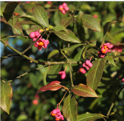
Le fusain d'Europe

Discret arbuste aux fleurs blanches jaunâtres, il s'embellie à l'automne de capsules roses qui laissent apercevoir à maturité des graines orange dont la forme rappelle celle des bonnets d'évêques. Bien que l'espèce soit intégralement toxique pour les humains, elle peut être carbonisée pour produire des bâtonnets de fusain, utilisés par les dessinateurs.