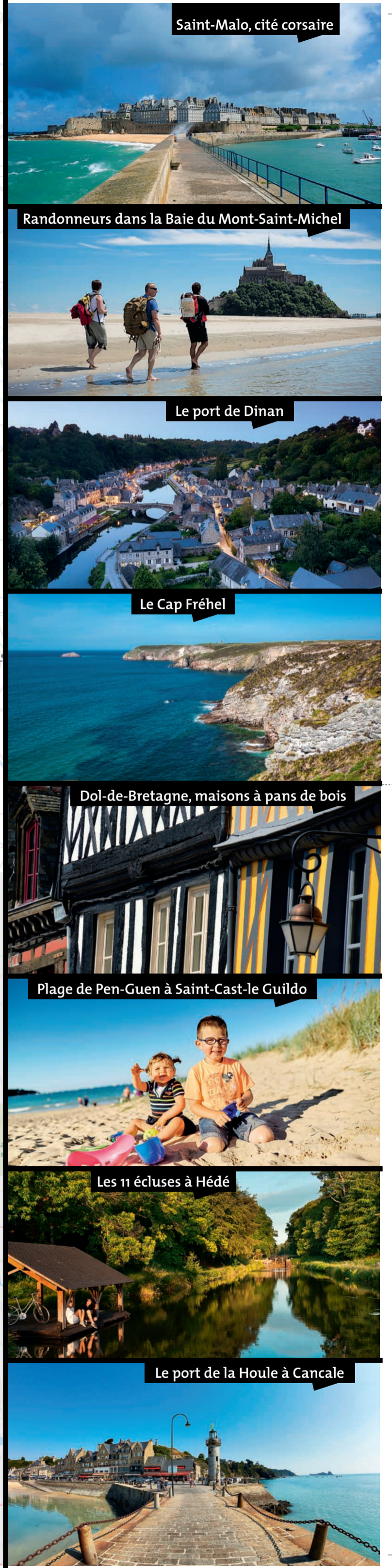
Saint-Malo, cité corsaire