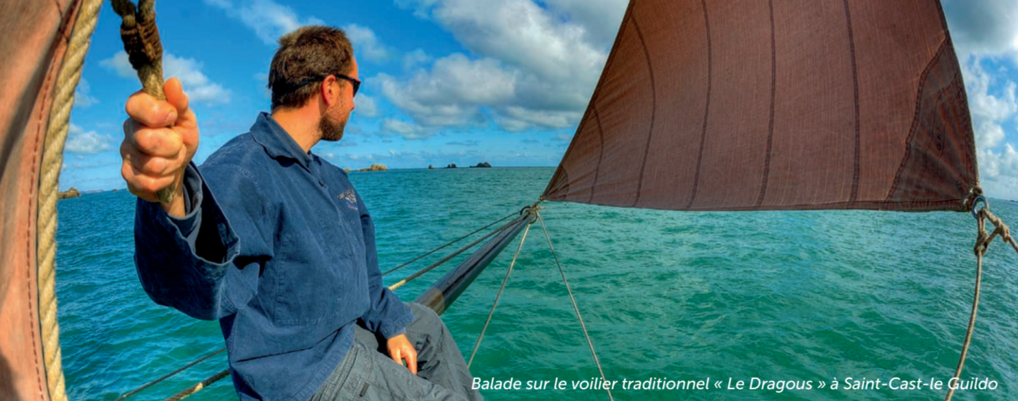
Balade sur le voilier traditionnel « Le Dragous » à Saint-Cast-le Guildo

La destination Saint-Malo Baie du Mont-Saint-Michel procure un potentiel de sports et de loisirs nautiques sans limite, grâce à un réseau de ports de plaisance, de clubs nautiques et d'associations qui dynamisent la pratique du nautisme sous toutes ses formes, sportive et amateur.