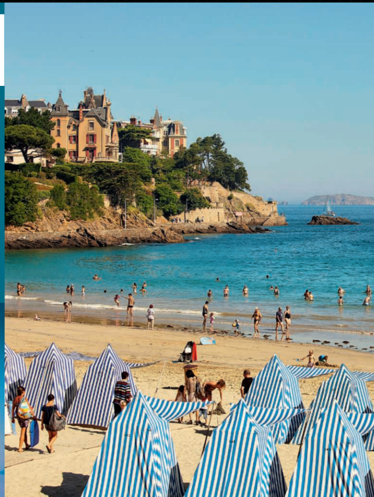
Dinard, Plage de l'écluse

Attention, ces écosystèmes sont fragiles, merci de vous renseigner sur les bonnes pratiques auprès des Offices de Tourisme.